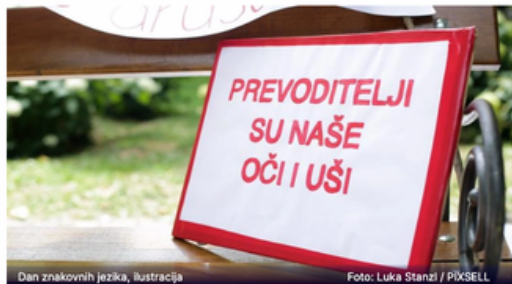
Dan znakovnih jezika, ilustracija

23.09.2022. | 20:04 | Autor: Irena Kožarić/Dnevnik/MŠ/M.Š./HRT